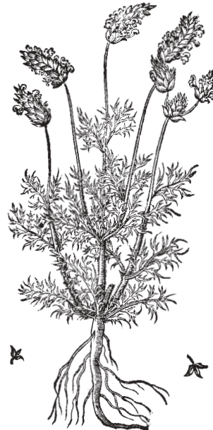
LAVANDULA Multifido folio, Clusij.

"È fuori un frastuono di gioco, per casa è un sentore di spigo... Che ha quella pentola al fuoco? che sfrigola sfrigola..."