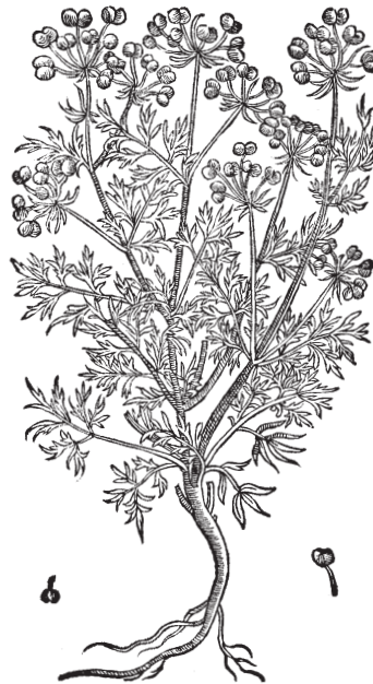
CORIANDRUM Alterum minus odorum, Lobell.

Gli Egiziani lo consideravano un afrodisiaco ed in epoca medioevale era utilizzato nella preparazione dei filtri d'amore; i Cinesi lo ritenevano persino capace di dare l'immortalità.