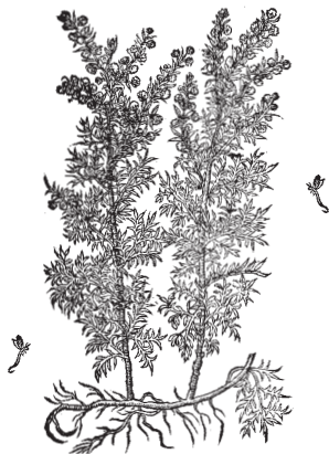
ABSINTHIUM Ponticum, Matth.

"Un rimedio di niun costo (contro la mosca cavallina) e alla portata di tutti è quello dell'artemisia, pianta che si trova dappertutto in abbondanza allo stato selvatico. Se ne faccia una infusione a freddo, se ne lavi la povera bestia (cavallo, mulo o asino), e l'insetto tosto scomparirà. Questo rimedio è ottimo contro un altro insetto ... quale si è il culex pipiens , volgarmente zanzara ." Così negli atti della Inchiesta agraria Jacini, edita nel 1883, al capitolo igiene del bestiame, nelle relazioni inerenti le provincie di Porto Maurizio e Genova.